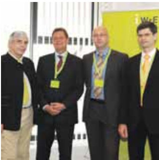
27 3er Gespräch: Globaler Energiemarkt