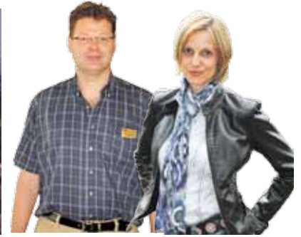
44 Arbeiten wo andere abschalten