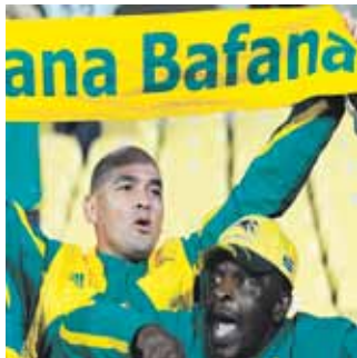
16 Nach dem Finale