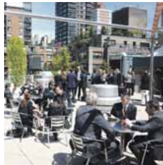
40 Mit der UNO im Geschäft