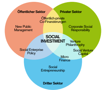
52 Kapital sucht Sinn