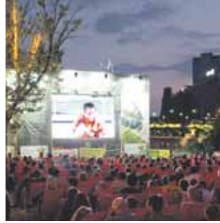
24 Jenseits von Afrika