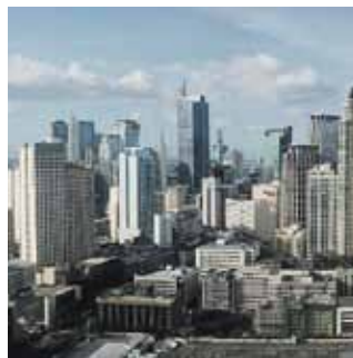
46 Business unter Palmen