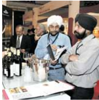
42 Messen machen Märkte