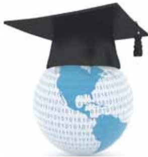
20 Globales Wissen 21