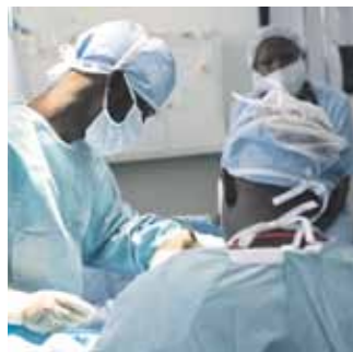
28 Return to Sender