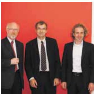
16 3er Gespräch: Wissen schafft Entwicklung