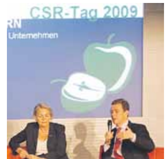
54 An Apple a Day