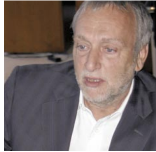
40 Welten verbinden