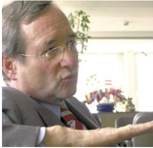
06 Globaler Sozialpartner