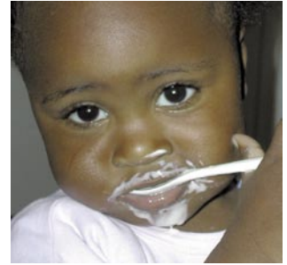
52 Ideen für's Leben