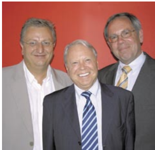
09 Entwicklung entwickeln