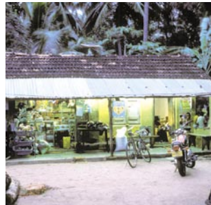
46 Reif für die Insel?