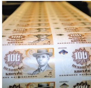
30 Ein Königreich und ...