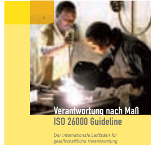
Beilage zu ISO 26000