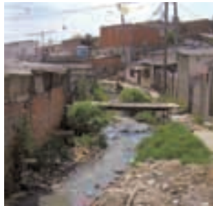
30 Die Sozial-AG