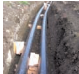
52 Bosnien: Zentral heizen