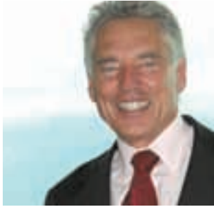
06 Es ist genug für alle da