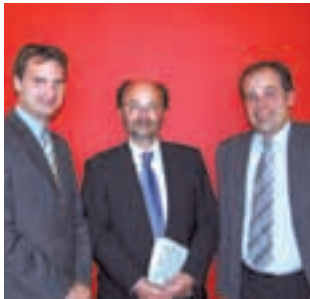
09 Wirtschaft entwickeln