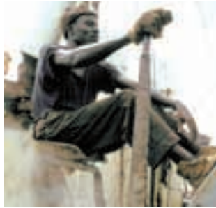
20 K(I)eine Größe